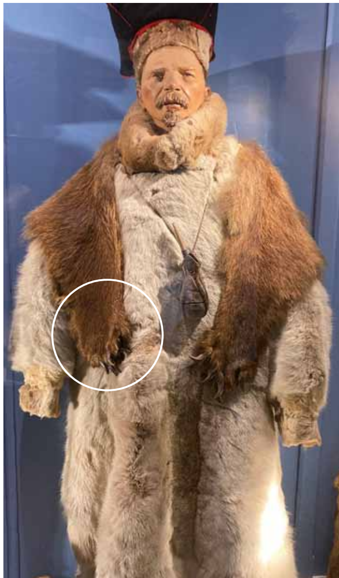
Un vestito di pelle d'orso, con le sue zampe ancora intatte compresi gli artigli. Proveniente dalla regione della Lapponia. (Museo Antropologico di Firenze).

Le popolazioni dei territori del nord Europa ci hanno lasciato dei reperti che testimoniano come la necessità li abbia stimolati a produrre oggetti in cuoio derivati da spoglie di animali che uccidevano per nutrirsi.