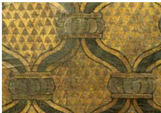
Particolare di corame (Museo Bardini di Firenze).

forma di pannelli, spalliere e sovrapposte, avevano la funzione di riparare dal freddo e dall'umidità. I paramenti in cuoio lavorato erano rari e provenivano dalla Spagna. Nel Cinquecento l'uso e la lavorazione dei corami d'oro si diffuse in tutta Italia. Con il cuoio erano realizzati anche tappeti da tavolo, rivestimenti di cuscini, cofanetti e pannelle, i cui motivi decorativi si ispiravano ad elementi architettonici o dai disegni delle stoffe. Sono gli