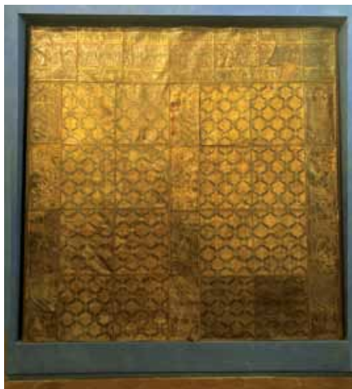
Pannello a muro in cuoio con fondo dorato, usato come tappezzeria negli appartamenti dei palazzi nobiliari (Museo Bardini di Firenze).