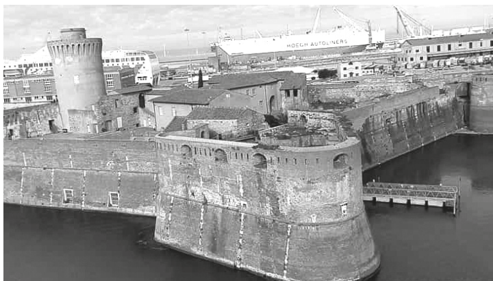
La Fortezza Vecchia

Il 19 marzo 1606, Ferdinando I concesse a Livorno il titolo di città. L'avventura era cominciata!