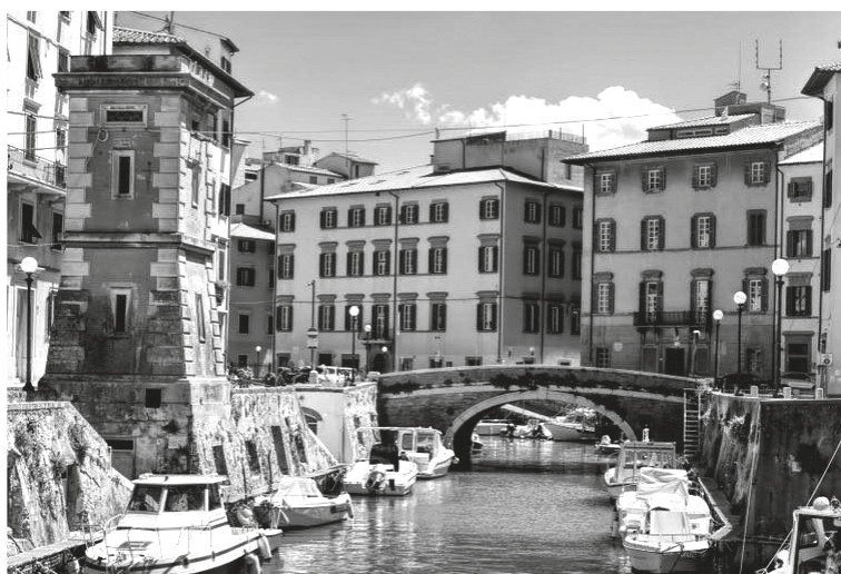
La Venezia Nuova – Uno scorcio

La città ebbe uno sviluppo straordinario, destinato ad arrestarsi poco dopo l'Unità d'Italia (1861), quando la concessione del porto franco fu abolita su tutto il territorio nazionale.