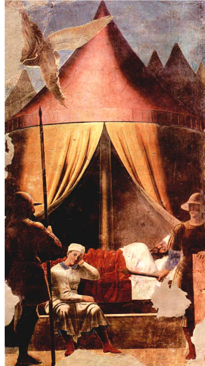
Piero della Francesca - Il sogno di Costantino

Padre mio, il tempo del tuo avvento incombe. L'imperatore dorme fiero, ma è l'uomo a bearsi di una nuova conquista.