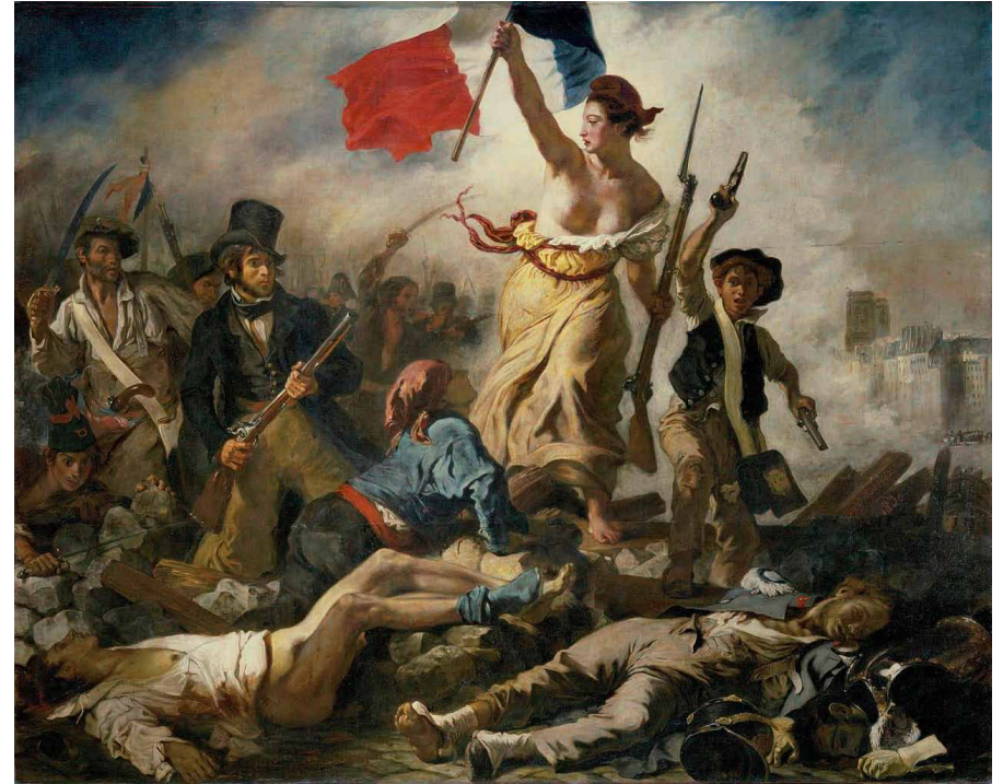
Eugene Delacroix: La Libertà che guida il popolo

Dolce Venere non sono morto invano! La mia felicità non è consistita nel possederti, ma nel renderti il fine dei miei sogni, ideale illuminante della mia condotta.