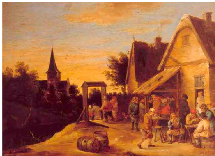
David Teniers il Giovane - Festa campestre

Tempo fa ti scorsi nella città dei mille, piccola crosta dispersa nella moltitudine. Una lacrima fluì per te, testimone dei miei anni, affresco sereno di un'era al tramonto.