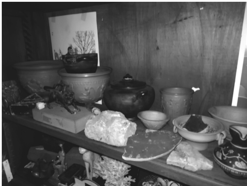
Gatteschi - collezione privata

Il suo processo di vetrificazione, tuttora segreto e dallo spessore fino a pochi millimetri, funzionale alla conservazione e trasporto degli alimenti, inimmaginabile in quel periodo storico, stravolse completamente gli usi e le abitudini alimentari, consentendo finalmente ad una massa immensa e negletta la possibilità di assaporare le infinite gioie della tavola.