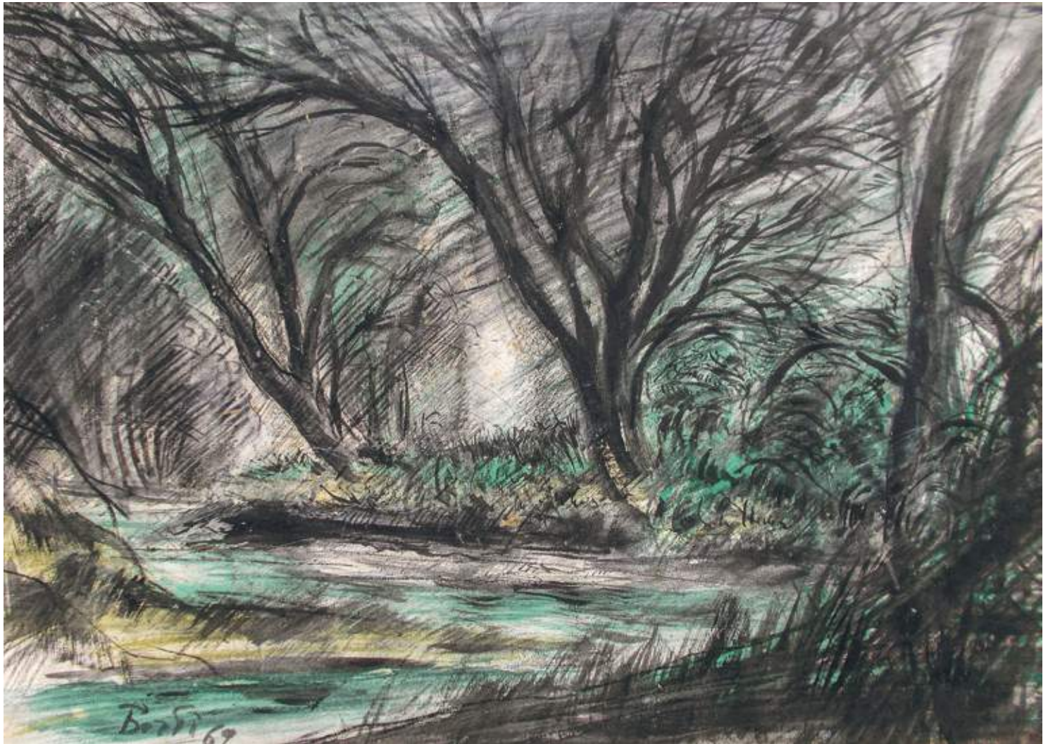
ANTONIO BERTI La Sieve in Appennino (1969) Tempere su cartoncino, cm. 46x64