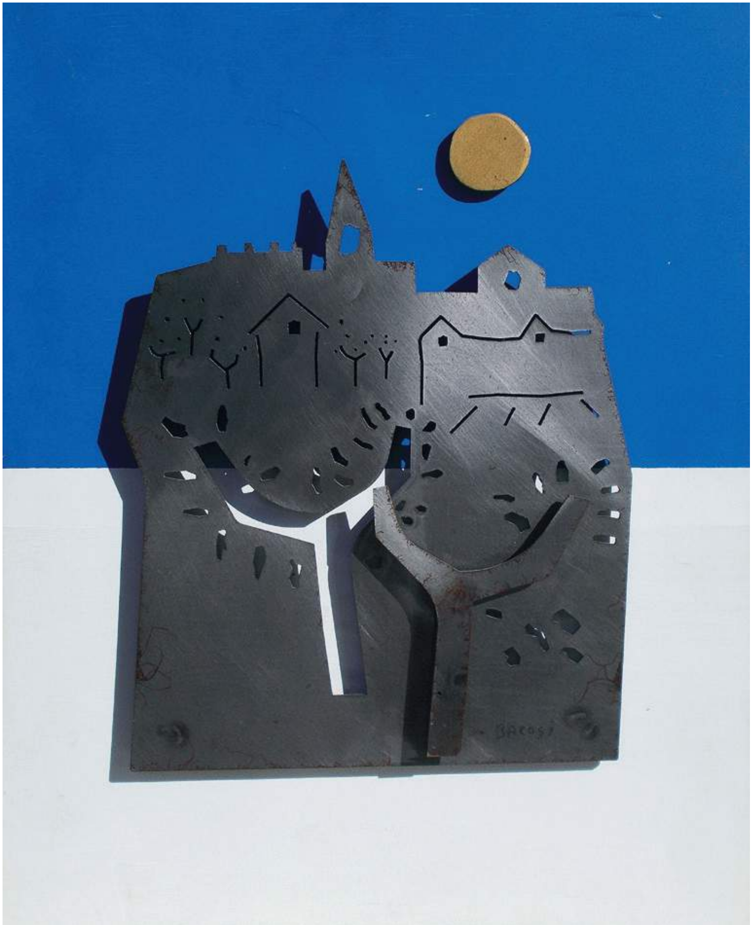
MANLIO BACOSI Cattedrale (1970)

Lamiera metallica e tempera su tavola, cm. 50x40