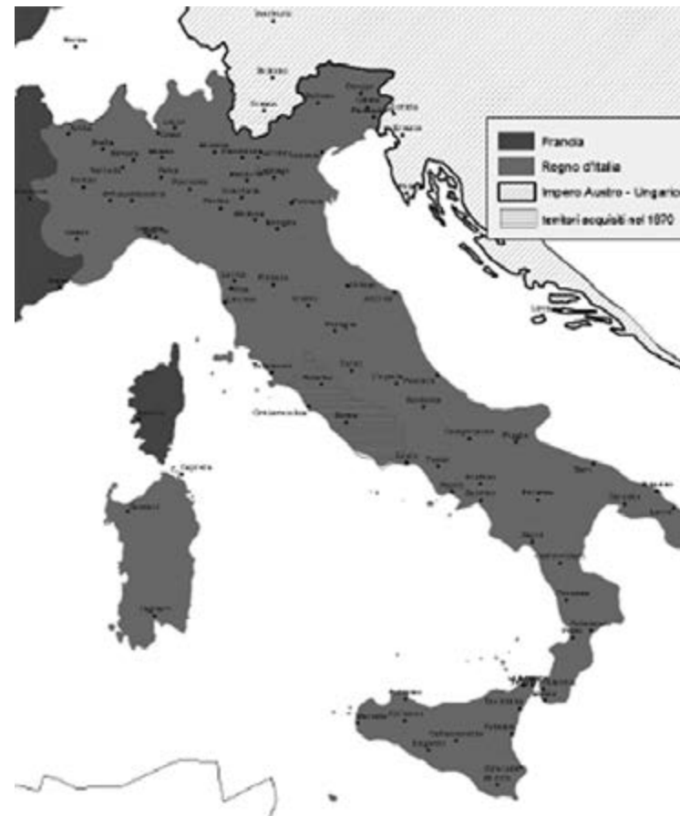
Il Regno d'Italia dal 1870 al 1914

Il Governo condusse a termine alcune riforme legislative e sociali riguardanti il lavoro, il suffragio universale maschile, la nazionalizzazione delle ferrovie e delle assicurazioni, la riduzione del debito statale, lo sviluppo delle infrastrutture e dell'industria. Nonostante tutto però il Mezzogiorno d'Italia attese inutilmente una riforma agraria socialista che redistribuisse i terreni, Giolitti infatti non intervenne in tal senso, puntando esclusivamente sul voto dei latifondisti.