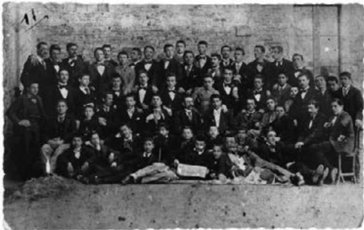
Collegio Carducci di Forlimpopoli Mussolini (quinto in terza fila partendo da destra)

Nel febbraio del 1902 riesce ad andare come maestro supplente a Pieve Saliceto, piccola frazione di Gualtieri Emilia, dove rimane fino a luglio del 1903.