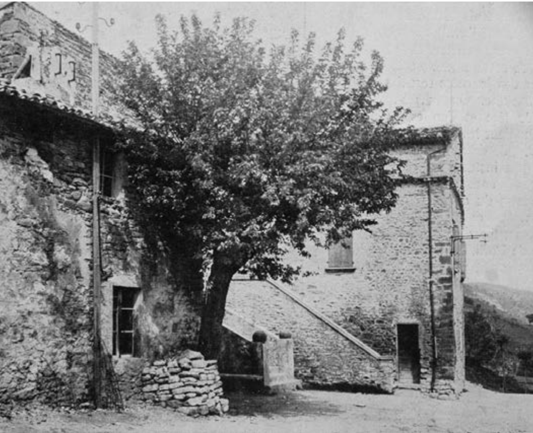
Casa Natale di Benito Mussolini