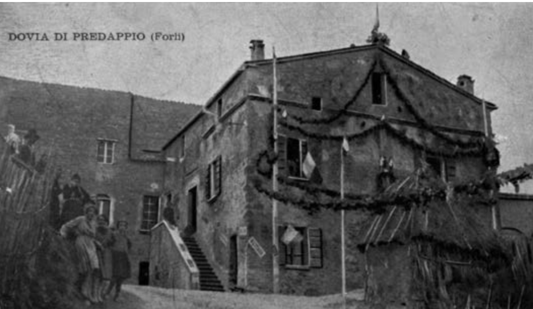
Casa Natale di Benito Mussolini