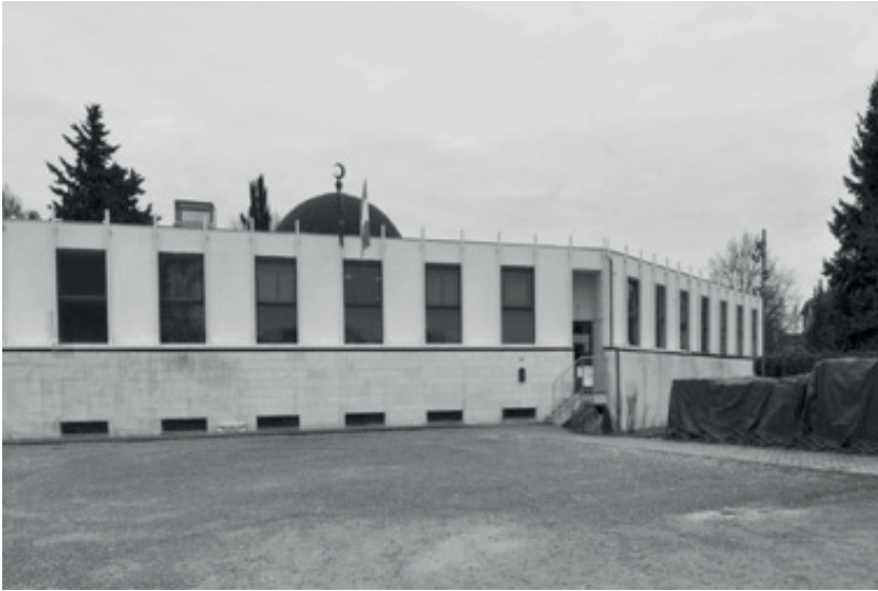
Moschea di Colle di Val d'Elsa

Né si possono ignorare le vicende dell'ultimo periodo della Diocesi di Colle di Val d'Elsa.