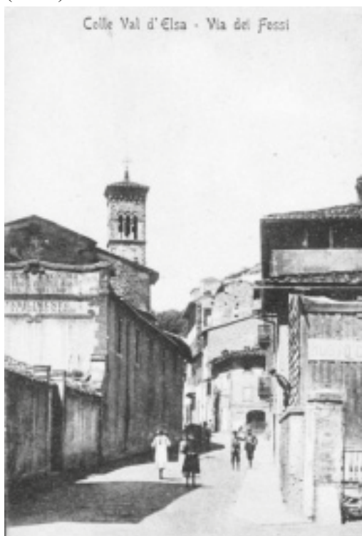
Nella cartolina dei primi decenni del Novecento si può leggere su una facciata della vetreria “Stabilimento Alfonso Nardi”