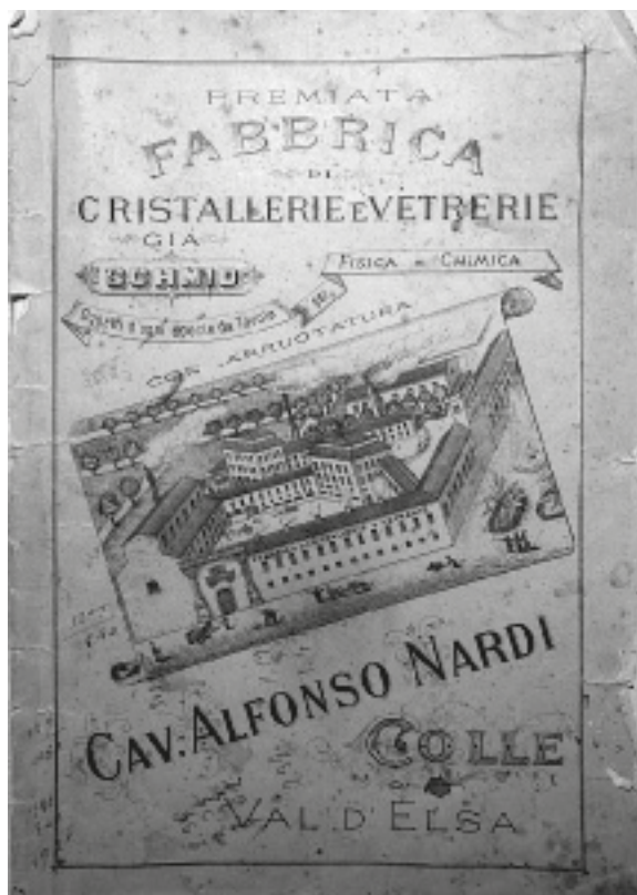
Copertina del Catalogo (APMM)

e 3°) articoli frizzati con una vasta gamma di varietà: